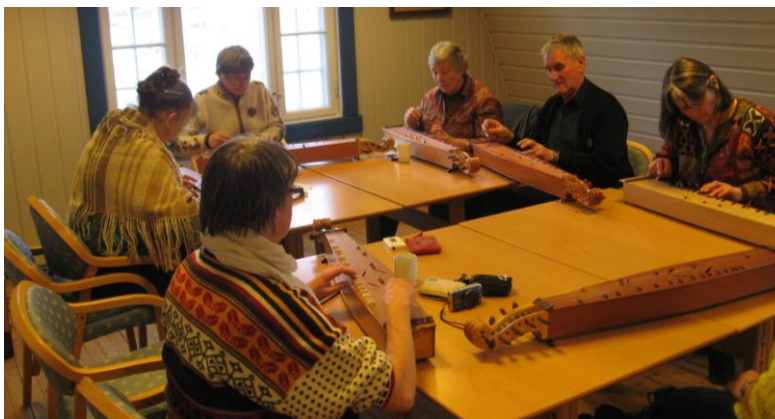
Gruppespel på årsmøtet